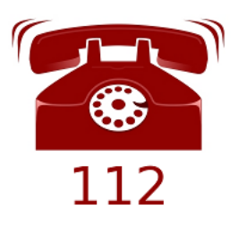
Llamar al teléfono de emergencias 112 si tengo algunos de los síntomas anteriores