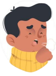
Tos seca y dificultades para respirar