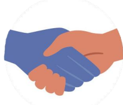
Por el contacto con personas enfermas. Por ejemplo, al tocarse o besarse