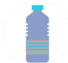
Por tocar objetos contaminados por el coronavirus