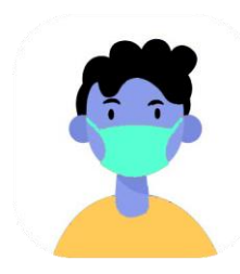
Evitar el contacto con personas enfermas. Utilizar mascarilla si estoy enfermo