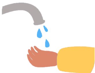
Lavarme las manos con frecuencia