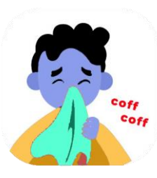
Toser y estornudar cubriéndome la boca con un pañuelo desechable