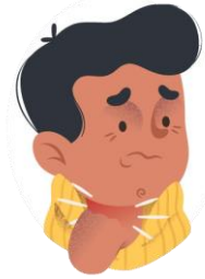
Dolor de garganta y de pecho