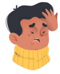
Dolor de cabeza y cansancio